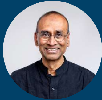
Venkatraman Ramakrishnan Cambridge University