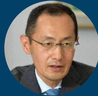
Shinya Yamanaka Kyoto University